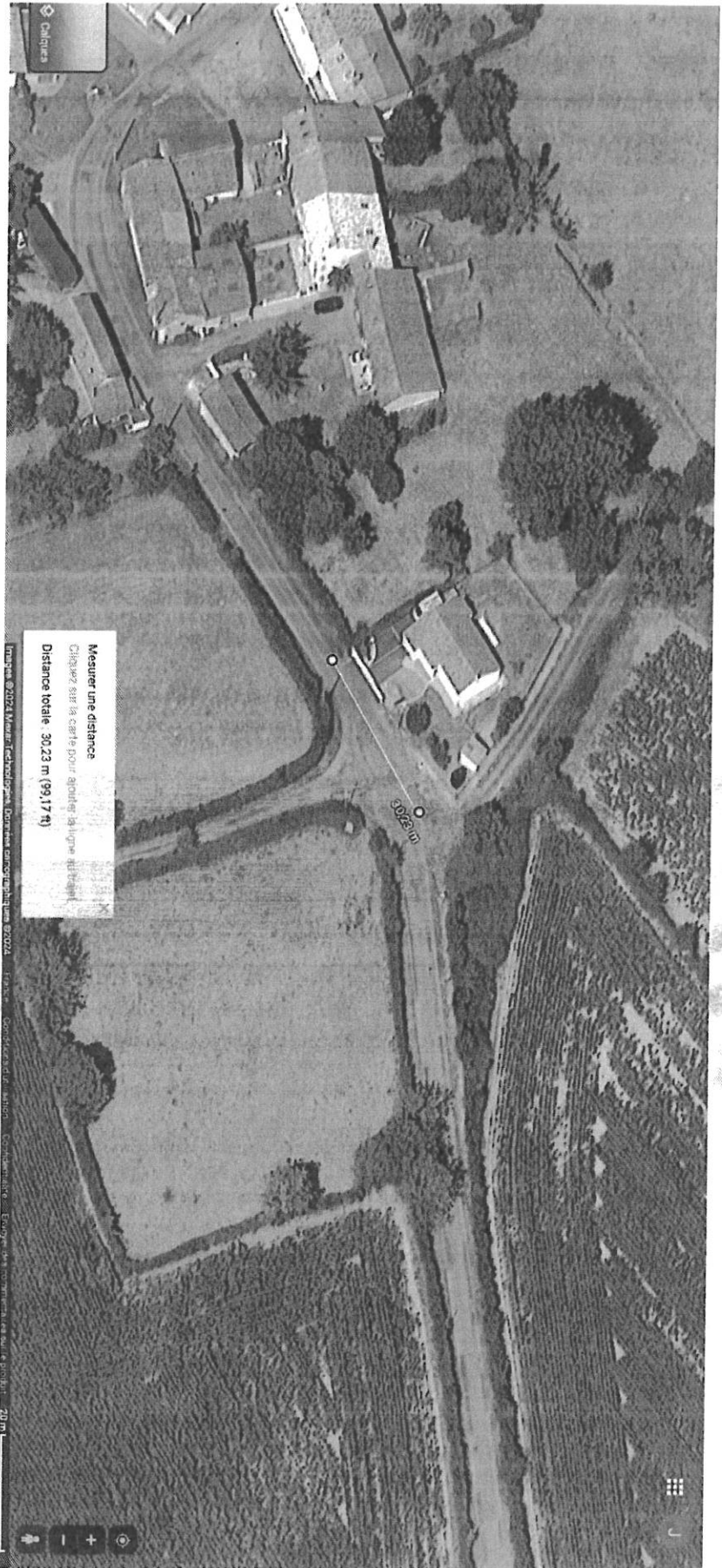
3 - La Tardivière - 30 m (en face de Froidefond)